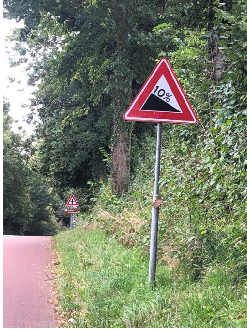
10% heuvels bij Slenaken, Voerstreek