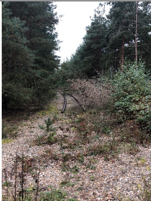
Einde spoorweg Vlodrop-Station

Op internet had ik gezien dat er een soort uitstulping Nederland is met de naam Vlodrop-Station. Er staat daar ook een hotel (waar geen plaats was) en het is niet duidelijk of ik vanaf daar verder kan rijden of terug moet.