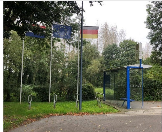
Grens weer over en snel naar huis bij Hommersum

Aan het einde van de Ceresweg, bij Siebengewald, hebben we in de gaten dat we "Thuis" vandaag niet gaan halen. We nemen nog een paar kilometer grens tot ons, maar bij Hommersum is het op. We gaan de grens over en via de Viller-Mühle en het Reichswald rijden we via Kleve en Emmerich de kortste weg naar huis.