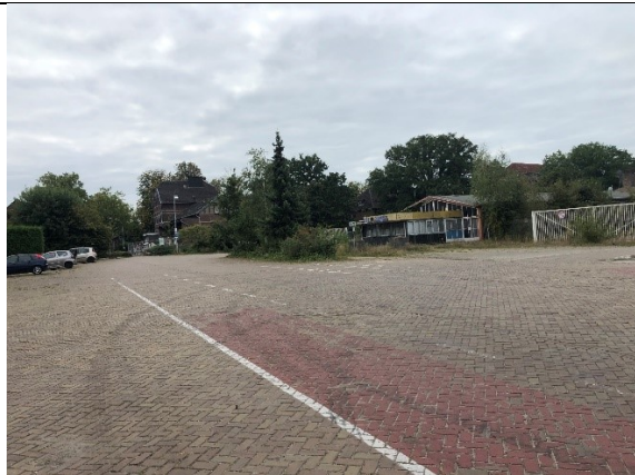
Verlaten grens in de buurt van Arcen

Boven Venlo, bij Lomm, gaan we weer zo dicht mogelijk langs de grens en we komen op een goede, snelle, simpel te rijden weg dwars door bossen en heiden. De weg komt van achter de Roompot bij Arcen, en hoewel we nog proberen nóg gekker te doen en bij een verlaten grenspost uitkomen, is deze weg langs de Kassen en Graskwekerijen en Maasduinen zodanig fijn dat we bijna alle tijd inhalen die we bij het zoeken en dwalen bij Vlodrop zijn verloren.