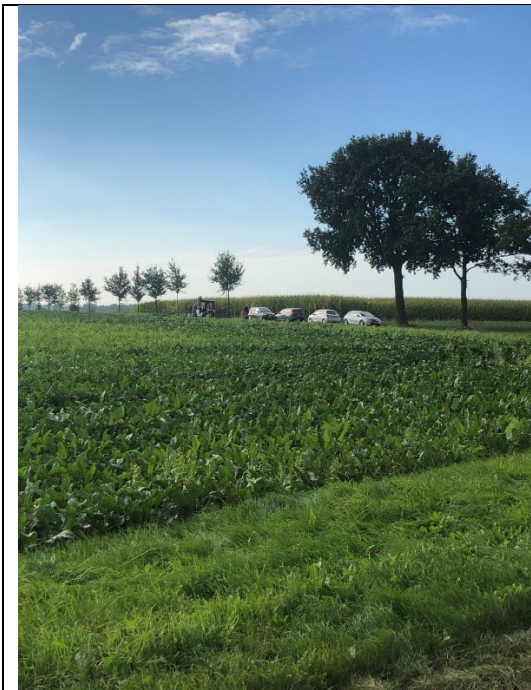
Vogelspotters ergens in Limburg

Het is 8:30 als de tent weer is ingepakt en ik het motorpak weer aan heb. We mogen weer op pad en voor we het weten zitten we in het Vlakke Limburgse land waar de rust regeert.