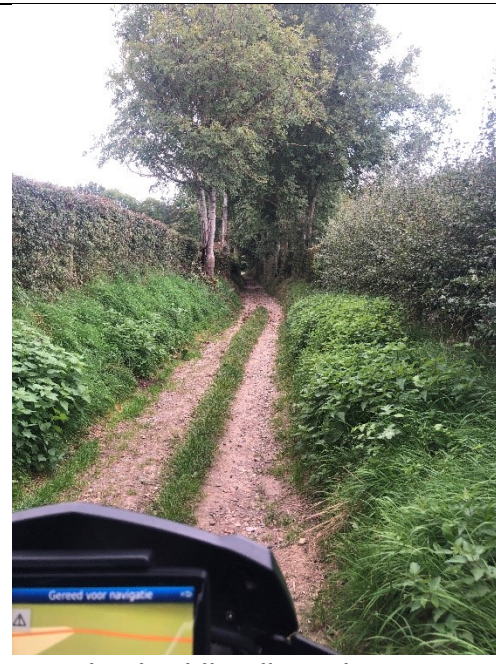
Gravelpaden bij Heijenrath

Dit gebrek aan politieke belangstelling betekent dat het een prachtige omgeving is voor wandelaars en fietsers en motorrijders die niet bang zijn voor af en toe wat off-road.