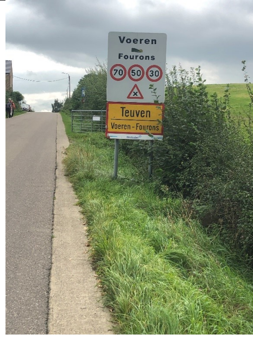
Van Slenaken naar Teuven: de Voerstreek

Het grensgebied van Slenaken – Epen – Vaals is politiek enigszins beladen vanwege de taalstrijd in het Belgische gedeelte. Dit grensgebied ligt ernstig ver weg van Den Haag en ook de Duitsers hebben er geen belangstelling voor.