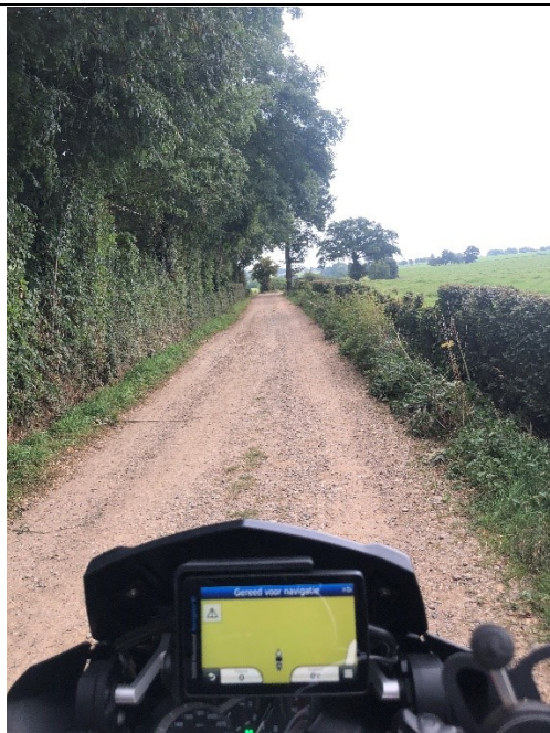
Zandpaden bij Heijenrath

Het grensgebied van Slenaken – Epen – Vaals is politiek enigszins beladen vanwege de taalstrijd in het Belgische gedeelte. Dit grensgebied ligt ernstig ver weg van Den Haag en ook de Duitsers hebben er geen belangstelling voor.