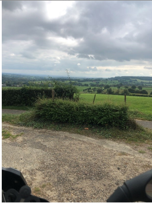
Heuvels bij Epen