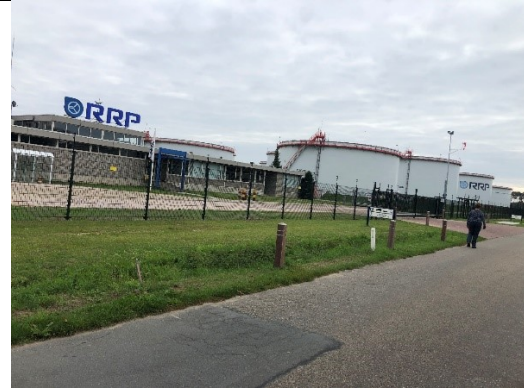
Rotterdam Rijn Pijpleiding + Olie opslag bij Venlo

Boven Venlo, bij Lomm, gaan we weer zo dicht mogelijk langs de grens en we komen op een goede, snelle, simpel te rijden weg dwars door bossen en heiden. De weg komt van achter de Roompot bij Arcen, en hoewel we nog proberen nóg gekker te doen en bij een verlaten grenspost uitkomen, is deze weg langs de Kassen en Graskwekerijen en Maasduinen zodanig fijn dat we bijna alle tijd inhalen die we bij het zoeken en dwalen bij Vlodrop zijn verloren.