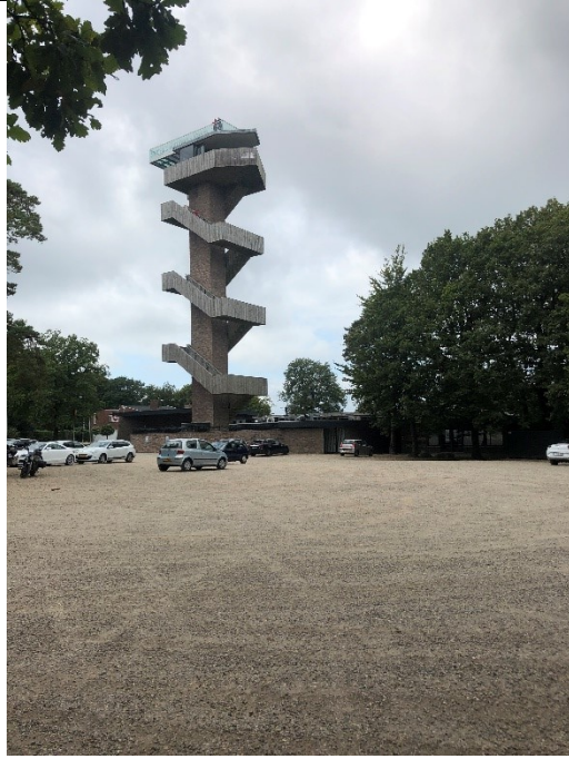
Koffie op de parkeerplaats . . .