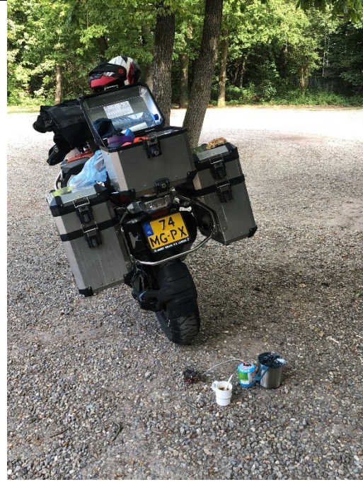
. . . van de Wilhelminatoren

Na de zoveelste koffie stop, met de zoveelste mueslibol, gaan we verder langs de grens tussen Limburg en Duitsland. We passeren een aantal indrukwekkende afgravingen waarbij ik heb nagelaten om te onderzoeken wat er is afgegraven, waarom, door wie en wanneer.