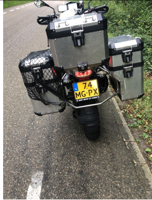
Koffer open op slingerweg naar Vaals

Als ik van Epen via de Epenerbaan naar Vaals en de Wilhelminatoren rij, dit is een heerlijke