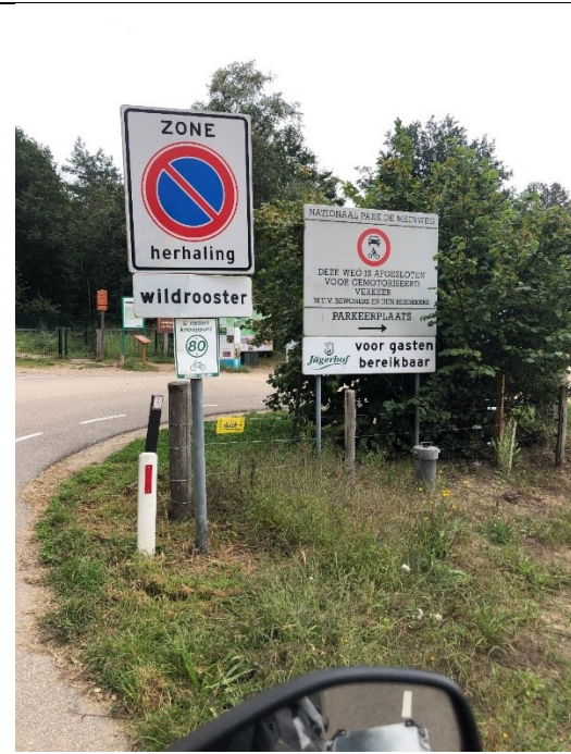
Park Meinweg gesloten

Uiteindelijk blijkt dat bij Vlodrop-Station de weg echt ophoudt. Net als de spoorlijn. Dus draaien we om en gaan kijken of we via Park Meinweg alsnog de bossen in de uitstulping door kunnen. Maar ook mijn weg via Park Meinweg is gesloten.