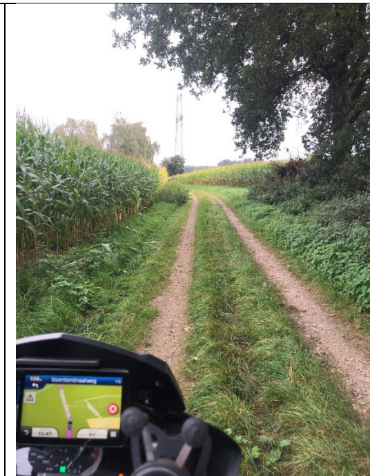
Bosweg bij Vlodrop en Herkenbosch