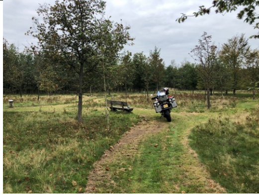
Parallelweg bij Swalmen, koffie en Snickers