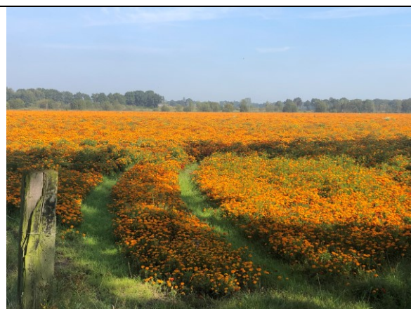
Oranje blommekes bij Weert

Als de koffie op is rijden we richting Stamproy en dan verder naar Ittervoort. Van Maasbracht zoeken we onze weg, via Ohé en Laak (helaas, mijn favoriete Hotel Restaurant is vandaag gesloten 😞) en Roosteren, door het smalste stukje Nederland. Bij Nattenhoven gaan we het Julianakanaal even over om bij Geulle weer aan de westkant te rijden, langs rijen vol bomen waarin Maretak wordt gekweekt. Apart, hoe deze parasitaire plant gekweekt wordt en dus expres mooie populieren worden opgeofferd.