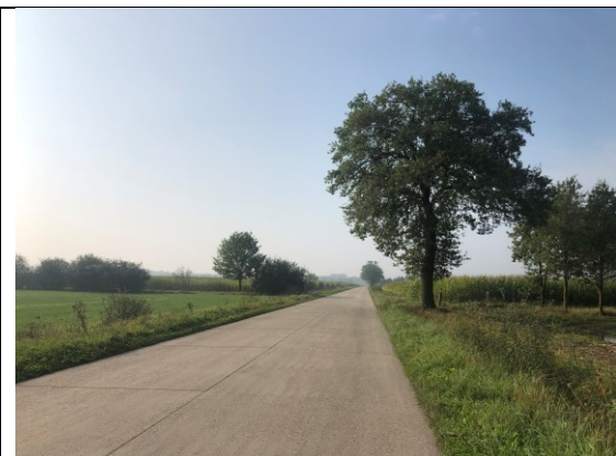
Lange kaarsrechte grensweg Arendonk

Het is even wennen om wegen te vinden die langs de grens lopen. De overgang van Nederland naar België is hier wat minder officieel dan bijvoorbeeld de grens met Duitsland, dus regelmatig vind ik mezelf dan weer aan de ene, dan weer aan de andere kant van het lijntje.