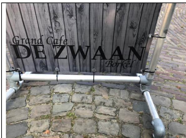
Koffie in Borkel en Schaft