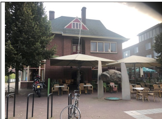
Terras met koffie Flanders in Goirle

Het is net negen uur en nog een klein stukje verder is het "ploeps" daar sta ik aan de Belgische grens.