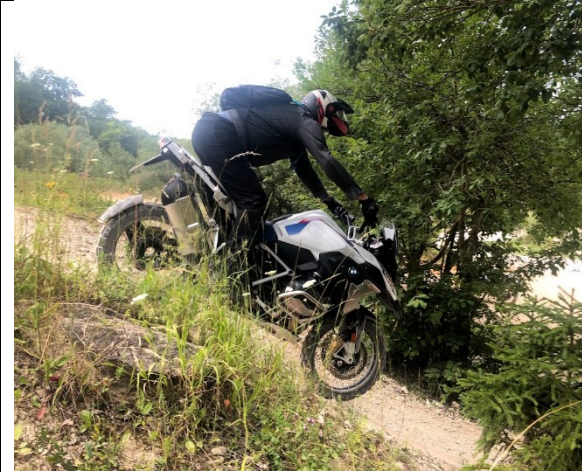
De man, soms gaat het omlaag