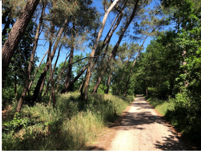
Bospad bij Huijbergen

In principe kan zo'n dag als vandaag weer niet lang genoeg duren. Mijn ingewanden denken daar iets anders over en mekkeren over het aantal calorieën in een bolletje Muesli. Bij het dorpje Essen geef ik hier aan gehoor en stop voor een blikje cola en een frietje saus Tartaar.