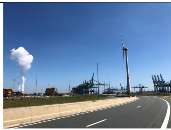
Industrie bij Beveren-Waaslandhaven

Net weer over de Nederlandse grens komen we bij het grenspark Kalmthoutse Heide. En als je weer even van de weg rijdt kom je op de mooiste stukjes Nederland.