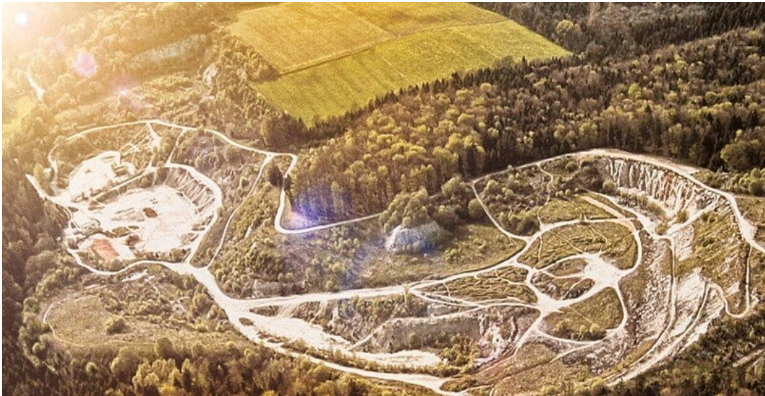
Voormalige steengroeve Enduropark Hechlingen

Lang verhaal kort, ik krijg van BMW geen positieve reactie en ik heb dus even geen lopende motor meer. Wordt vervolgd.