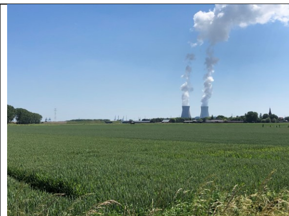
Koeltorens bij Nieuw Namen

We komen in de buurt van de havens van Antwerpen en zien diverse harde economische feiten door het beeld schuiven.