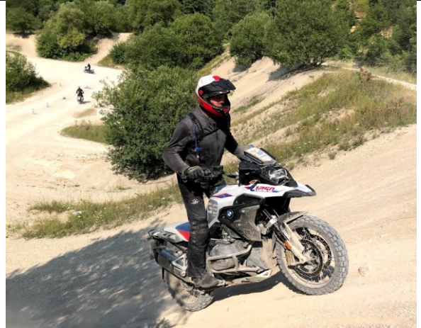
Soms gaat het een flink eind omhoog

De volgende dag zijn we al aardig gewend aan de machines en de heuvels worden steiler en langer en de paden worden smaller en kronkeliger. Totdat we 's middags in een colonne van 8 motorfietsen het park verlaten en in de heuvels rond het park zo'n 30 km offroad gaan rijden. Al met al een ervaring waar weliswaar niet de vonken van af spatten, maar zeker leerzaam en moeilijk te vergelijken met enige training die je in Nederland kunt volgen. Ook deze ervaring is van het lijstje afgevinkt.