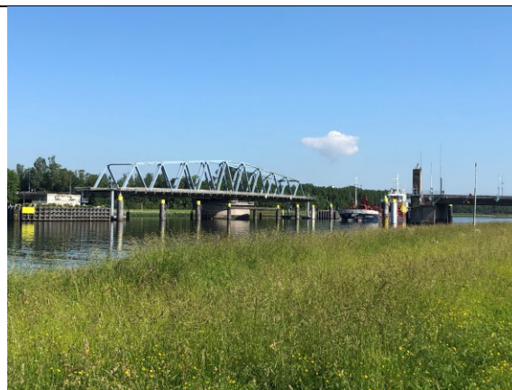
Draaibrug Sas van Gent

Na deze heerlijke pauze, inclusief een sanitaire stop in het struweel (wij noemen dat "loofcontrol") gaan we op pad voor een dagje Grens-met-België. Eerst rij ik nog een rondje door Sas, maar zie nergens een luchtpomp voor mijn banden.