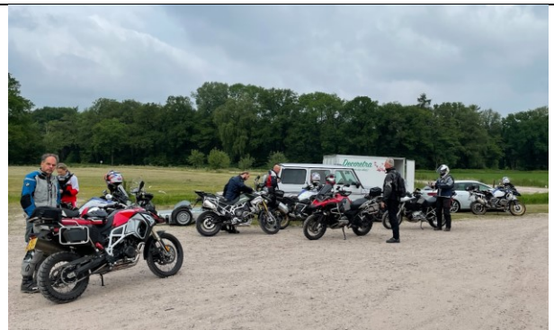
Verzamelen in Esbeek

Na een kop koffie helemaal klaar voor wat de dag gaat brengen. We rijden rustig de eerste zandwegen op, die gelukkig redelijk vastgereden zijn. Om warm te worden.