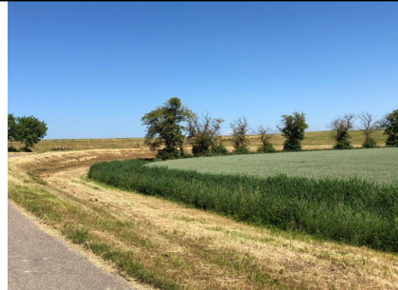
Vlakten bij Nieuw Namen

We nemen het besluit om via België, zo dicht mogelijk tegen de Nederlandse grens, de provincie Zeeland te verlaten om dan straks langs de grens van Noord-Brabant weer verder te gaan.