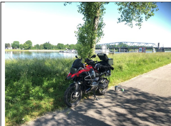
Aan het kanaal, koffie plus