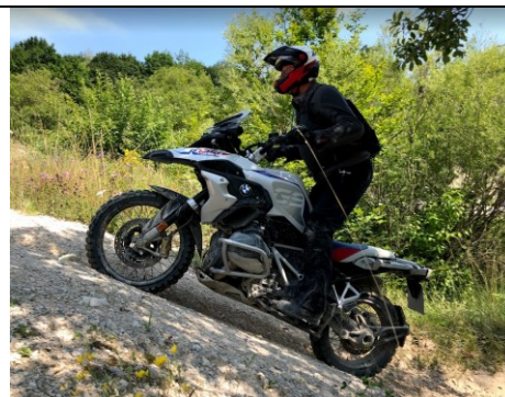
De man, soms gaat het omhoog

In plaats van met de motor ben ik met de auto naar Hechlingen gereden. Het hotel is uitstekend, echter zonder airco en het is een beetje warm.