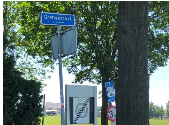
De beste plek om even te stoppen.

Met die vette handel in de topkoffer rij ik nog een paar kilometer voor een goede plek om te lunchen. Wat dacht u van een plekje onder het bord "Grensstraat" op de hoek van België?