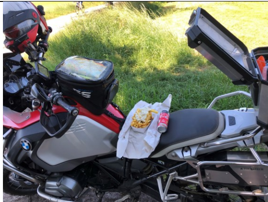
Frietje Saus Tartare bij Schijf (Essen B)

In principe kan zo'n dag als vandaag weer niet lang genoeg duren. Mijn ingewanden denken daar iets anders over en mekkeren over het aantal calorieën in een bolletje Muesli. Bij het dorpje Essen geef ik hier aan gehoor en stop voor een blikje cola en een frietje saus Tartaar.