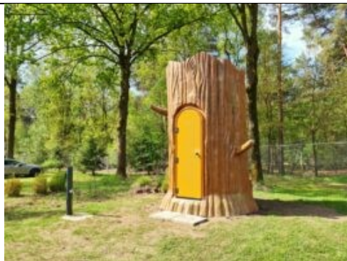
Prive sanitair-boom in Vessem

Zaterdag 12 juni is het tijd om te verzamelen bij Herberg In Den Bockenreyder in Esbeek. Een kleine groep van 6 man plus 2 begeleiders, Kees-Jan en Erwin