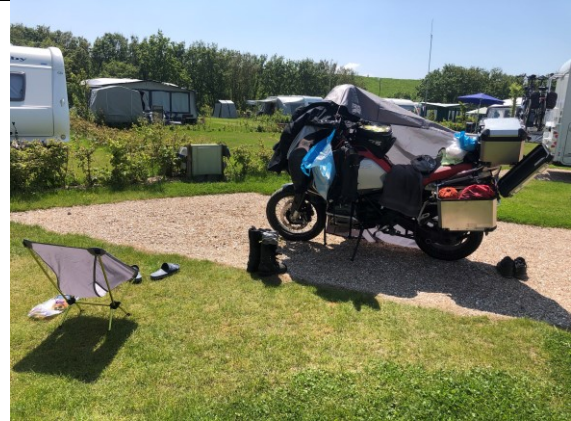
Kamperen in Zeeland: bagage ophalen