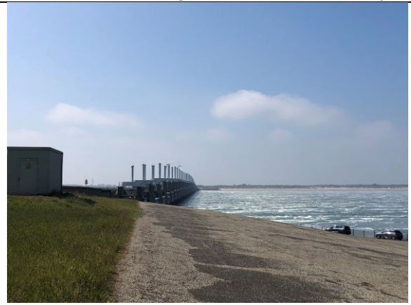
Stormvloedkering bij Neeltje Jans