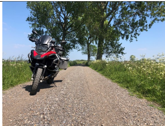
Offroad in Zeeland bij Biervliet