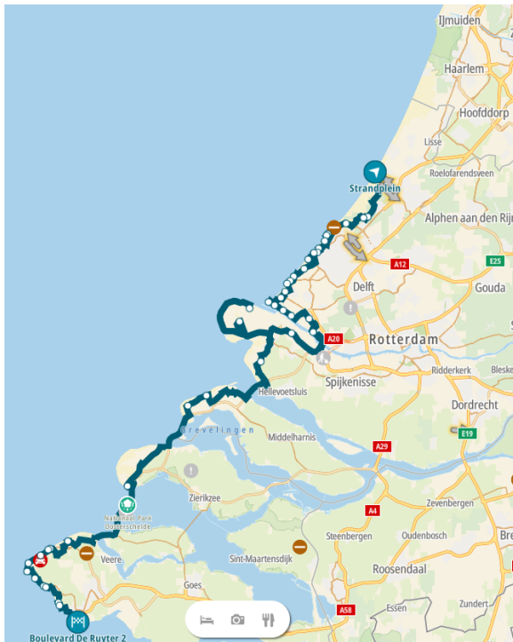
Figuur 1 Shape of NL W Z

Het is een week later dan de vorige etappe. Ik heb alweer twee dagen vrij om te besteden aan mijn hobby (motorrijden) en mijn project (rondje Nederland).