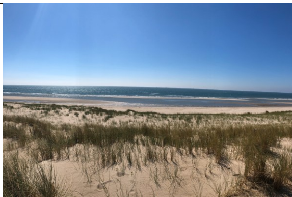
Maasvlakte Rotterdam, zeezicht