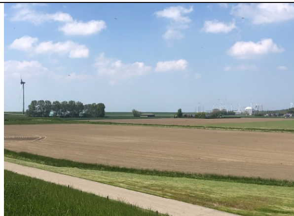
Dijk langs Borsele