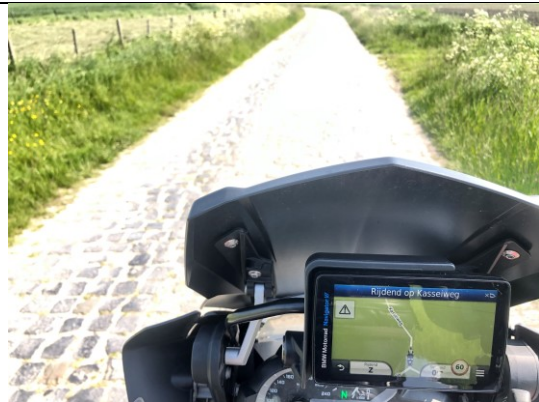
Kinderkopjes/kasseien bij IJzendijke