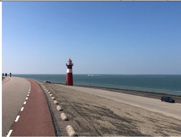
Terug naar Neeltje Jans en dan dijk Westkapelle

Nu we eenmaal op Walcheren zijn besluit ik om een einde aan de dag te maken en ik zet koers op een bekende camping bij Vlissingen. Net voor de camping koop ik een paar blikjes