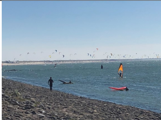
Kitesurfers bij Ouddorp

Bij Ouddorp proberen we weer zoveel mogelijk langs de dijken te rijden en we komen uiteindelijk op de Brouwersdam die het Grevelingenmeer scheidt van de Noordzee. Langs die dijk liggen grote zandvlaktes die als strand worden gebruikt. Tientallen buscampers met stoere mensen, waarvan er honderden op het water laten zien wat ze met een vlieger en een surfplank kunnen doen.