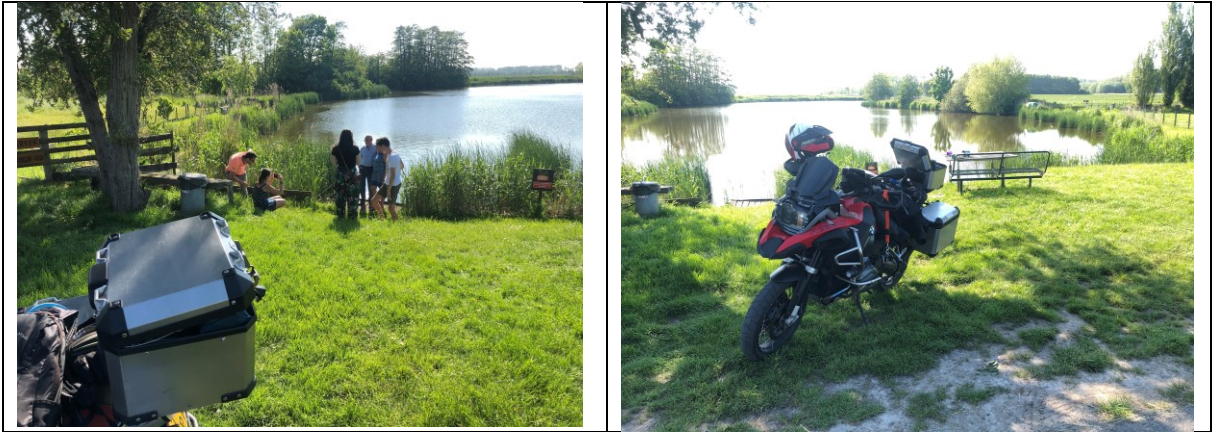
Vredig lunch met koffie bij Assenede