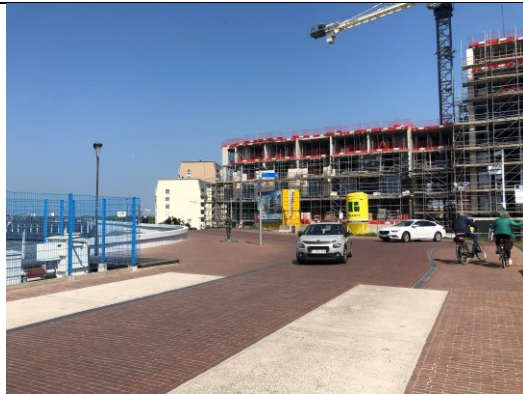
Nieuwbouw in Cadzand