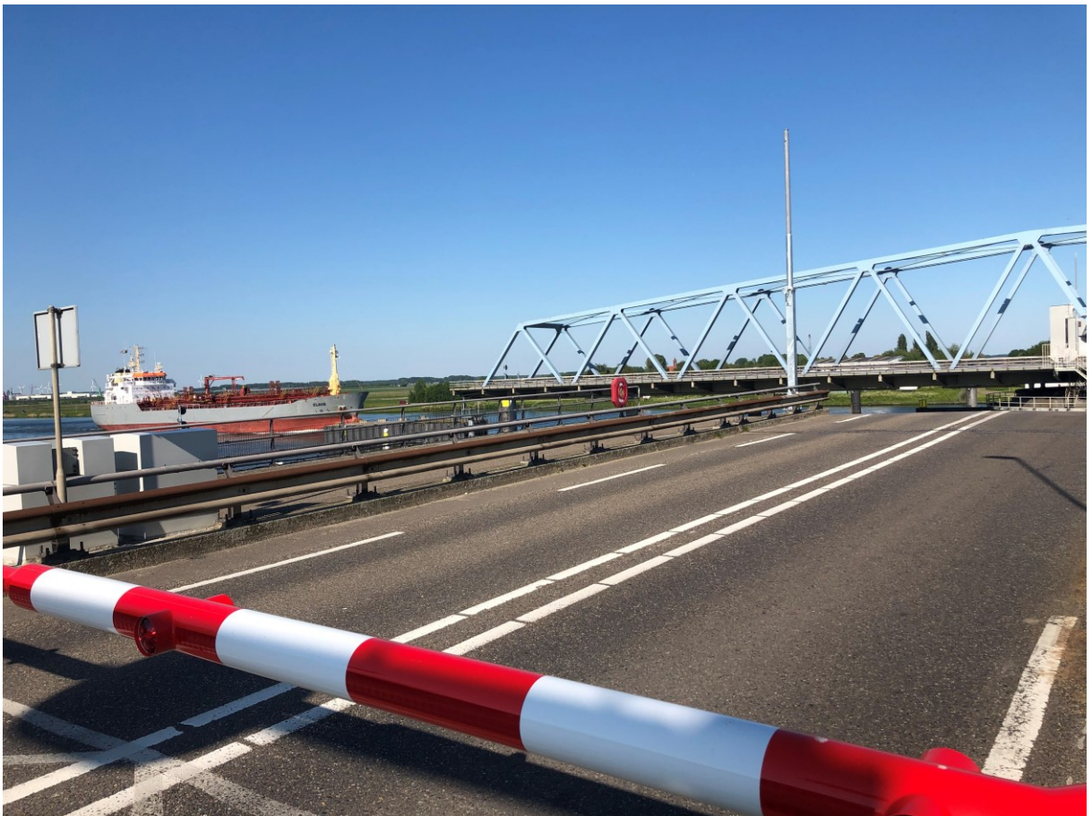
Slagboom Sas van Gent: einde van de rit, van de dag, van het weekend.