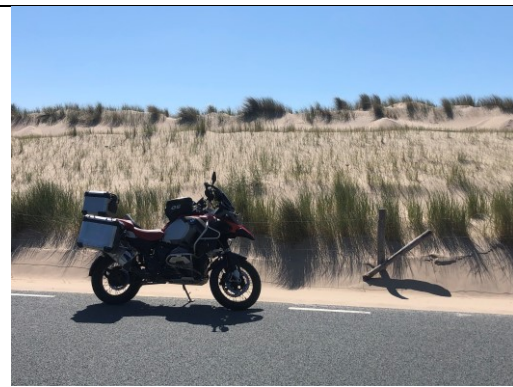
Maasvlakte Rotterdam, motorzicht

Vorig jaar ben ik met mijn echtgenote al eens naar de Maasvlakte geweest, met de fiets, en we hebben daar ook een rondvaart geregeld en een bezoekje aan Futureland om iets meer te leren over de commerciële betekenis van de haven.